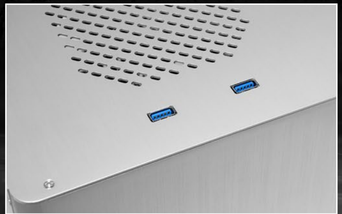
2x USB3.0 (interner 19-pol.Mainboardstecker)